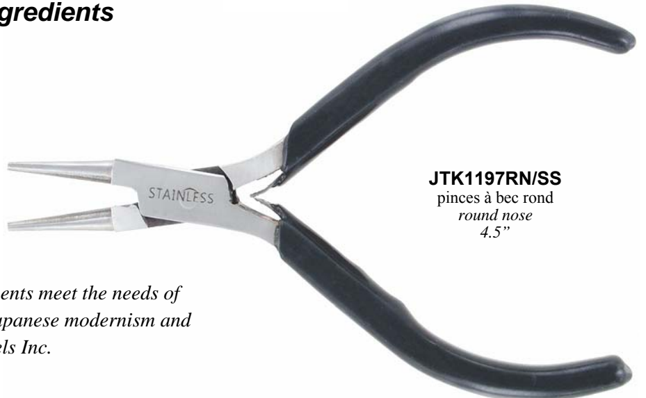
JTK1197RN/SS pinces à bec rond round nose 4.5"

Kuromu Moda stainless steel jewelry components meet the needs of discerning jewelry designers by combining Japanese modernism and Italian styling. Exclusively available at Frabels Inc.