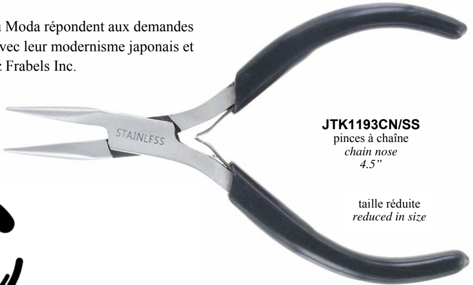
JTK1193CN/SS pinces à chaîne chain nose 4.5"