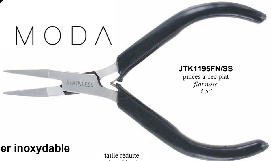
JTK1195FN/SS pinces à bec plat flat nose 4.5"