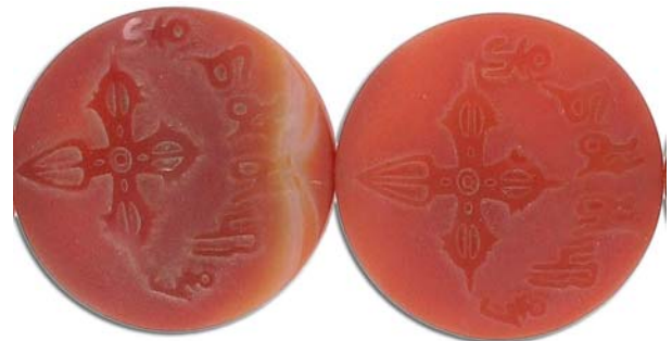
SPBD40DC/AGA agate / agate

Les couleurs et tailles de pierres semi-précieuses peuvent varier légèrement. All semi-precious stones subject to slight variation in size and colour. Tous les articles sont de grandeur réelle sauf si indiqué autrement. All items in this flyer are actual size unless indicated otherwise.