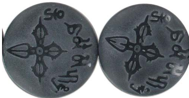
SPBD40DC/BLK agate noir / black agate