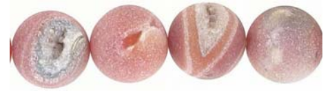
SPBD14MM/ODQ frosted orange druzy quartz