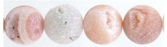
SPBD16MM/GDQ gris quartz grey druzy quartz