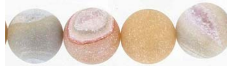
SPBD14MM/GDQ gris quartz grey druzy quartz