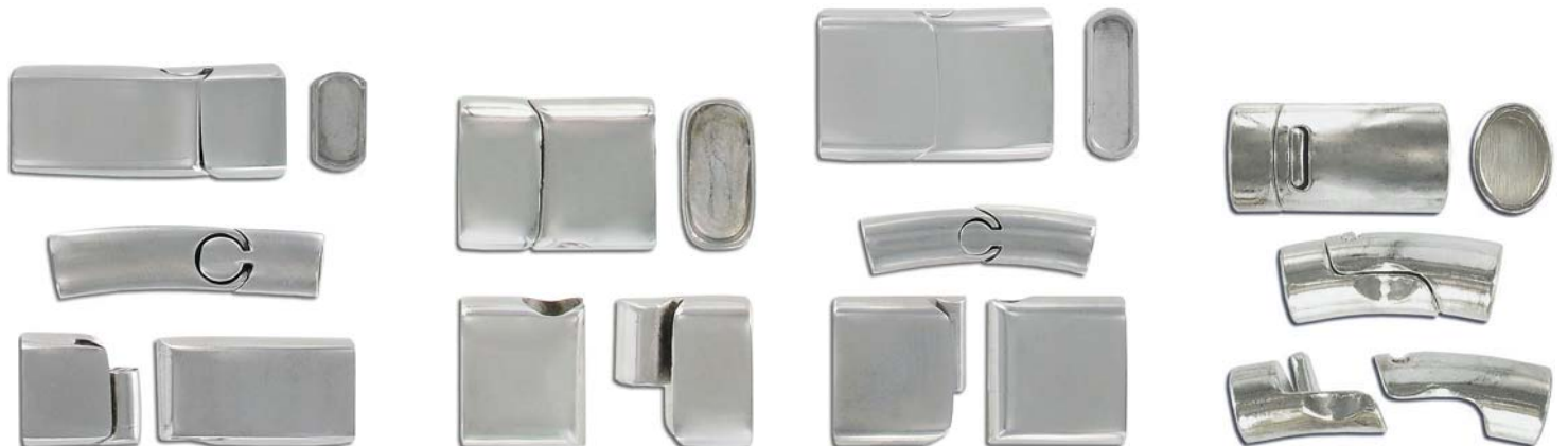
CL719M/SS 32x14mm 12x5mm ID