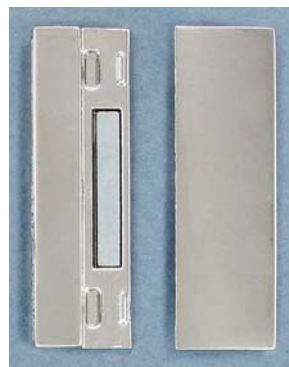
CL90M/WH 20x42mm ID 2.5x39mm magnétique magnetic