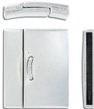
CL59M/OXWH 24x30mm ID 28x2mm