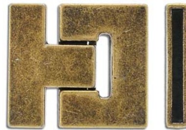
CL82M/OXBR 36x33mm ID 3x30mm magnétique magnetic