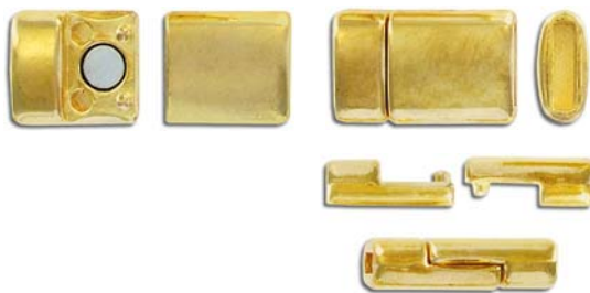
CL55M/GL 21x13mm ID 2x10mm