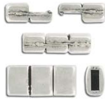
CL694M/OXWH 18x8mm 5x2mm ID