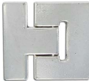
CL82M/OXWH 36x33mm ID 3x30mm