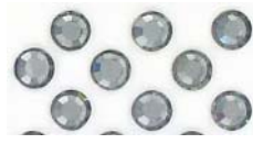
CRSA/SS20/204 diamant noir black diamond