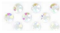
CRSA/SS20/301 cristal AB/AB crystal