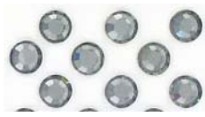
CRSA/SS20/204 diamant noir black diamond